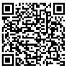
会议邀请函二维码

中国土壤学会： http://www.csss.org.cn/ 广东省土壤学会： http://www.soil.org.cn/