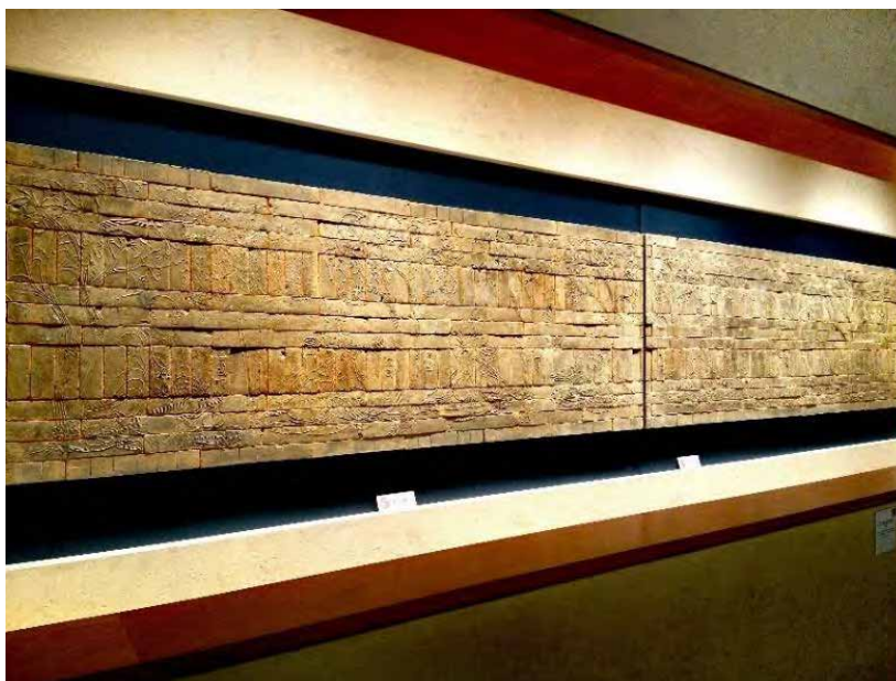
“竹林七贤与荣启期”模印拼镶砖画（南京博物院）， 而意大利语中“砖”为 Terra-cotta，意为“烧过的泥土”

事实上，土壤就像空气、水和阳光一样，在维系人类生存方面起着不可替代的作用。“百谷草木丽乎土”（《易·离》），除了提供食物之外，土壤还有许许多多的功能。土壤可以缓冲污染物，保护环境；可以将产生温室气体的碳固存在土壤之中，成为“碳库”；可以作为建筑物的支撑材料；也可以作为蚯蚓等土壤动物以及微生物的安身之所，是陆地表层系统中最大的生物多样性保存场所和基因库；土壤还可以提供相对稳定的封闭环境，保存自然文化遗产；另外，有些土壤还是珍贵的旅游资源。离开了土壤的哺育，人类文明难以为继。