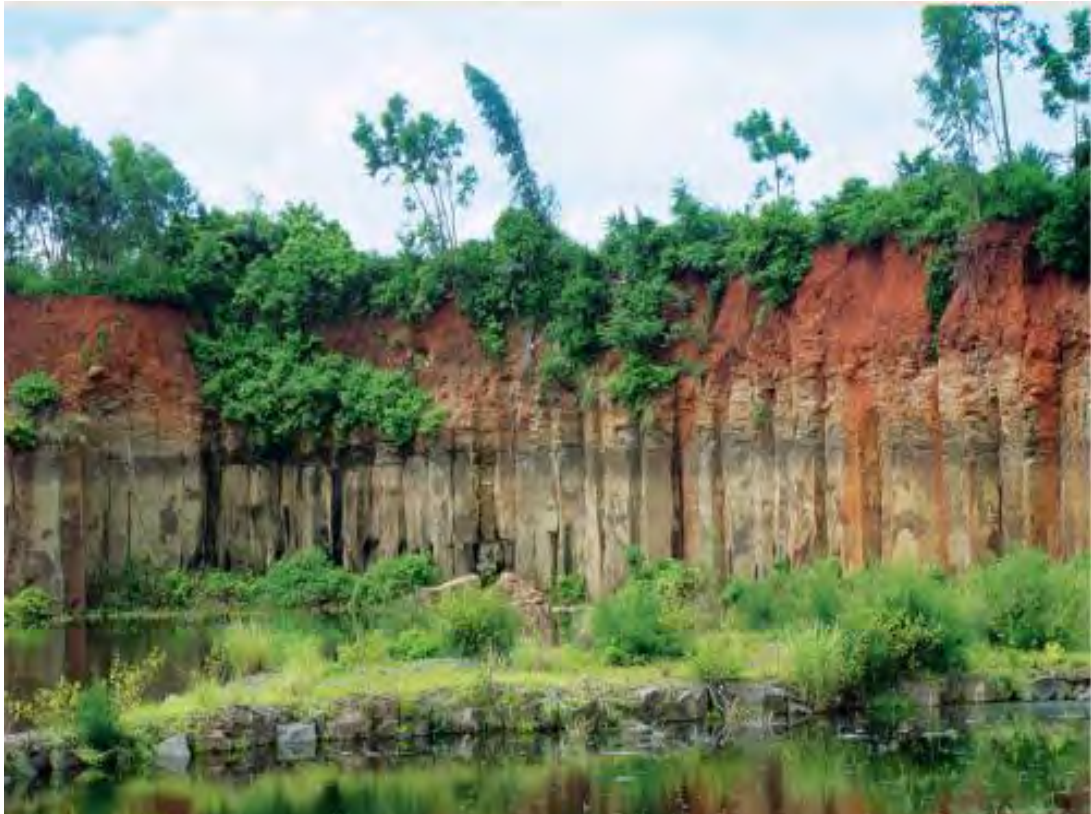
玄武岩上发育的铁铝土景观（广东徐闻），土壤的“前世今生”在此清晰可见：基岩、风化物和土壤层次依次排列

母质为土壤的发生发育提供最初的物质来源，是构成土壤矿物质、提供植物所需养分的物质基础。气候通过温度和降水全面影响成土过程中的物理、化学和生物作用的强度和方向。生物（包括植物、动物和微生物）在自身的生命活动过程中与土壤发生物质和能量交换，改变了土壤结构和孔隙状况，使土壤形成腐殖质层从而具有肥力特征。地形的作用又会进一步影响上述成土因素对土壤的作用，以及利用重力对地表的物质和能量进行重新分配。当然，任何因素对成土过程的影响都与时间有关，作用程度随时间的延长而加强。