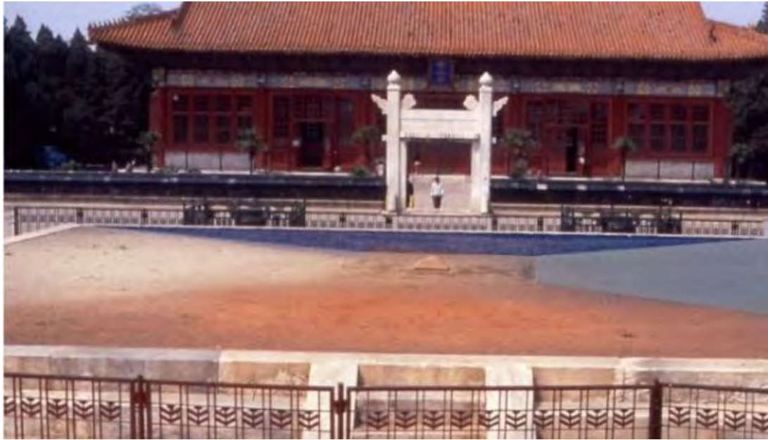
北京中山公园社稷坛中的五色土

实际上，土壤有着“五色”之外更为丰富的颜色变化，作为表征土壤物质组成差异的重要指标，土壤颜色在实际中也有着重要的应用价值。传统意义上，人眼观察识别土壤信息主要局限在可见光范围。比如，土壤学者常用 Munsell 比色法（包括色调、明度、彩度 3 个参数，用数字来精确描述各种色彩）来表示土壤颜色，由于土壤颜色一定程度上反映了土壤的物质组成，土壤学者甚至在野外调查过程中就能做出土壤物质组成、土壤性质及其主要特征的充分肯定的判断。