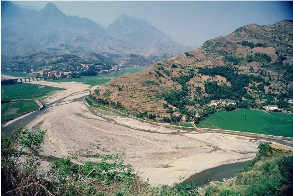
水土流失造成河道淤塞和耕地损失

古人云：皮之不存，毛将焉附？生产性土壤的进一步流失将严重威胁粮食生产和安全，加剧粮价波动，有可能使数百万人陷入饥饿和贫穷。然而，人们在仰望星空探索未知的时候，常常忽视了自己脚下所踏立的土壤。文艺复兴巨擘达·芬奇就曾直言“我们对自己脚下土壤的了解，远不及对浩瀚的天体运动了解得多”。作为地球皮肤的土壤，需要人们的关注和呵护。